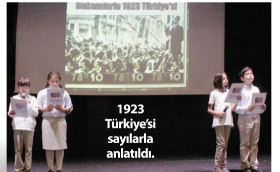
1923 Türkiye'si sayılarla anlatıldı.