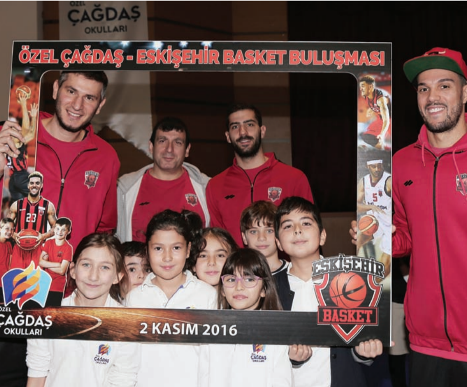
Panelde soru ve cevapların ardından hatıra fotoğrafı çekimine geçildi. Tüm sınıflar ayrı ayrı sahneye inerek basketbolcularla hatıra fotoğrafı çekti. Bu anlarda miniklerin mutluluğu adeta gözlerinden okundu.