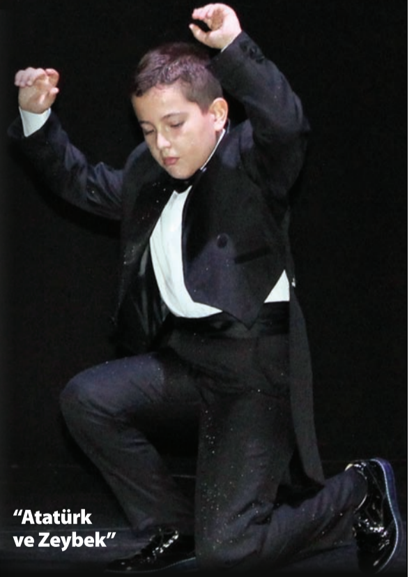
"Atatürk ve Zeybek"

"Ve mavi gözleri çakmak çakmakta, Yürüdü uçurumun başına kadar, eğildi durdu, Bıraksalar, ince uzun bacakları üstünde yaylanarak Ve karanlıkta akan bir yıldız gibi kayarak, Kocatepe'den Afyon ovasına atlayacaktı."