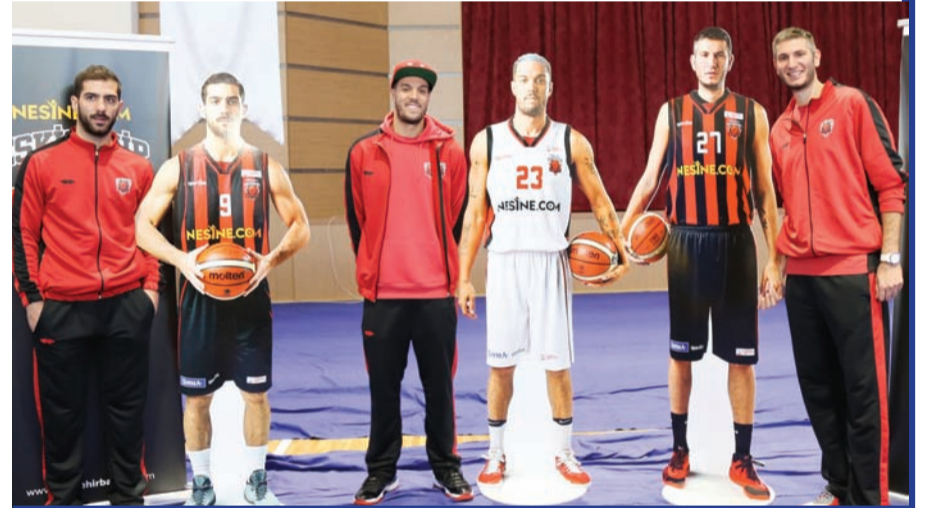
Kulübün bire bir ölçülerinde yaptırdığı maketlerini ilk kez Özel Çağdaş Okullarında gören basketbolcular, maketleriyle poz vermeyi ihmal etmedi.