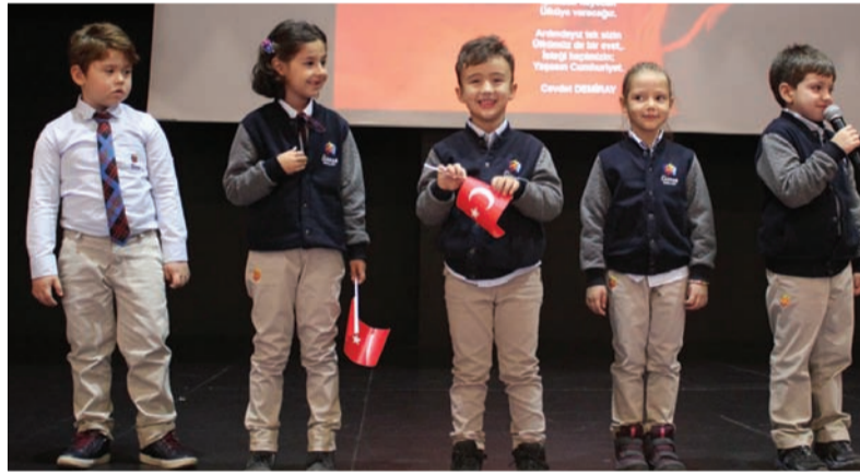
1. sınıf öğrencileri şiirler okudu.