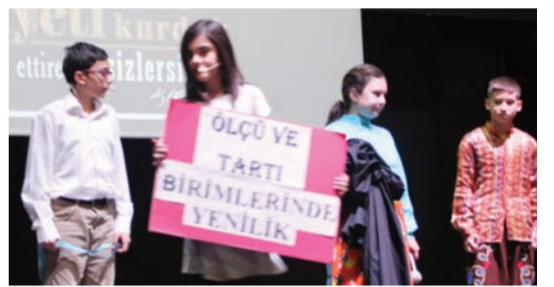
4 ve 6. sınıf öğrencileri cumhuriyetin kazanımlarını renkli gösterilerle canlandırdı.