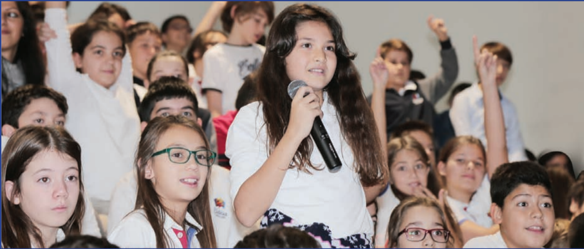
Öğrencilerin soruları zaman zaman kahkahalara neden oldu.